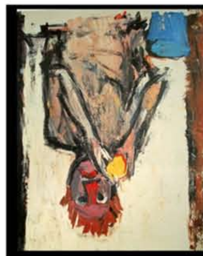
Georg Baselitz, Mangeur d'orange II, 1981, cm.140x114, collezione privata

La prospettiva e quindi il punto di vista non è solo un modello matematico-geometrico ma una forma mentis, una ipotesi di rappresentazione ovvero di conoscenza della realtà. Il punto di vista è un problema che coinvolge la fisica, la matematica, l'arte, la biologia, la storia, la filosofia, la scienza, la geografia... Le figure capovolte di Georg Baselitz, oltre ad essere probabilmente una grande trovata pubblicitaria, sono anche - e soprattutto - un invito a stravolgere il punto di vista che non è e soprattutto non deve essere sempre unico.