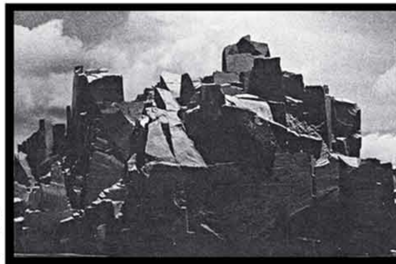
Bruno Munari: "Da lontano era un'isola, con le sue costruzioni, le terrazze, i vari piani inclinati. Girando dietro l'isola si vede la parte più selvaggia, inabitabile, anche perché quest'isola è una pietra grande sei per quattordici centimetri, più piccola di un gabbiano junior"

Un sasso diventa un'isola ed un'isola diventa un sasso se inquadrato e quindi viste da vicino o da lontano.