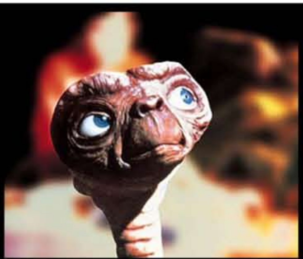
ET di Steven Spielberg, 1982

Guardare le stelle non è solo un gesto da astrofili o romantici. Guardare le stelle è anche scoprire nuove prospettive, nuove possibilità di approccio e conoscenza alla e della realtà.